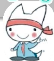
あべ太くん (マスコットキャラクター)